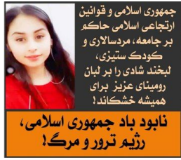
جمهوری اسلامی و قوانین ارتجاعی اسلامی حاکمه بر جامعه، مردسالاری و کودک ستیزی، لیخنه شادی را بر لبان رومیهای عزیز برای همیشه خشکاند!

نابود باد جمهوری اسلامی، رژیم ترور و مرگ!