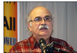
مردم مبارز ایران!

جمهوری اسلامی در مقابله با خیزش آبان دست به جنایتی زد که در تاریخ معاصر ایران بی سابقه است. کشتار صدها نفر و دستگیری هزاران نفر پاسخ حکومت جلادان به اعتراض بر حق ما مردم به گرانی بزنین و به فقر و فلاکت غیر قابل تحملی بود که آیت الله های میلیاردر بر جامعه حاکم کرده اند. نباید اجازه داد این جنایت هولناک به فراموشی سپرده شود. یاد جانباختگان آبانماه را باید با فریاد اعتراضمان و با اعلام کیفرخواست علیه جمهوری اسلامی بزرگ بداریم.