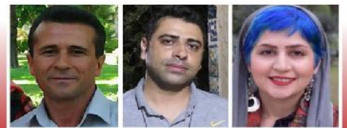
زنده باد اول مه